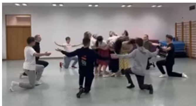
Niebawem studniówka (3 lutego). Trwają przygotowania.